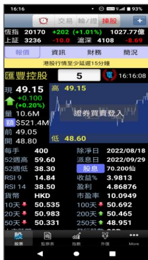
圖 1. 按圖表中的“證券買賣登入”