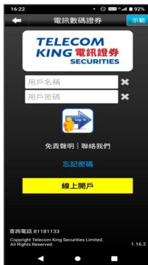
圖 2. 輸入 6 位數字的證券帳號及 8-12 位的電子登入密碼