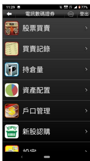
圖 4. 順利登入證券帳戶