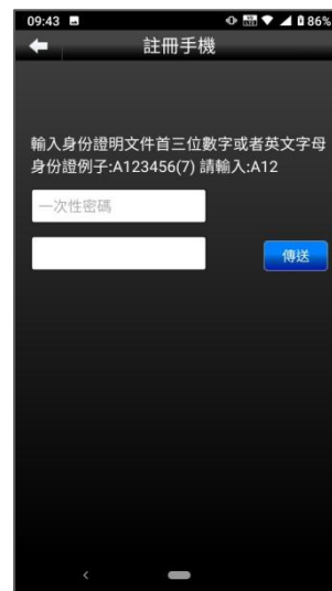
圖 3. 輸入短訊接收到的 4 位數字一次性密碼和身份證首 3 位字元